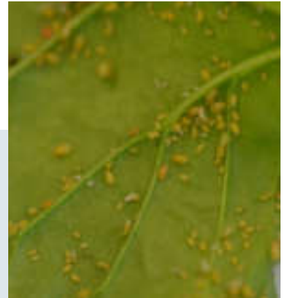
Feuille de betterave recouverte de pucerons.

→ Impact recherché : mieux connaître la dynamique d'apparition des pucerons et des jaunisses, développer des outils prédictifs pour diffuser des conseils adaptés aux conditions climatiques de chaque année.