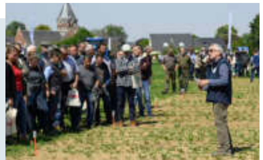
Réunion d'échanges autour d'un champ de betteraves

→ Impact recherché : transmettre les avancées de la recherche de façon régulière au plus grand nombre afin que les betteraviers se les approprient rapidement.