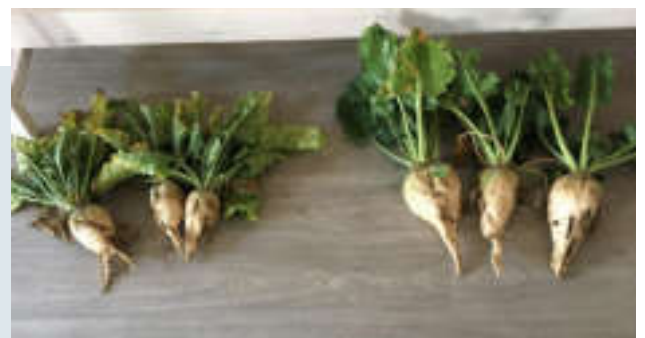
Quand la jaunisse fait des dégâts : Betteraves atteintes à gauche et non atteintes à droite.

→ Impact recherché : présenter aux agriculteurs, au fur et à mesure de leur obtention, les solutions permettant la culture de la betterave sans néonicotinoïdes et en initier le déploiement.